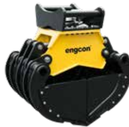
SK20 con lados herméticos (accesorio)