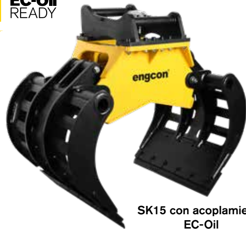
SK15 con acoplamiento EC-Oil