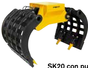
SK20 con puntas (accesorio)